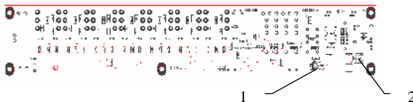
Рисунок 1.3 – Элементы настройки БСТЛ

где 1 – регулировка уровня сигнала с линии;