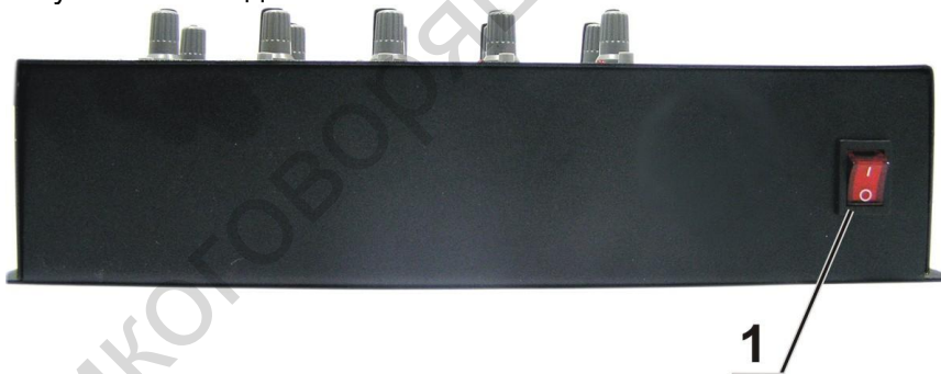
Рисунок 3.2 – Задняя панель БС

Разъем подключения линий связи и разъем (задняя панель РС) изображены на рисунке 3.2